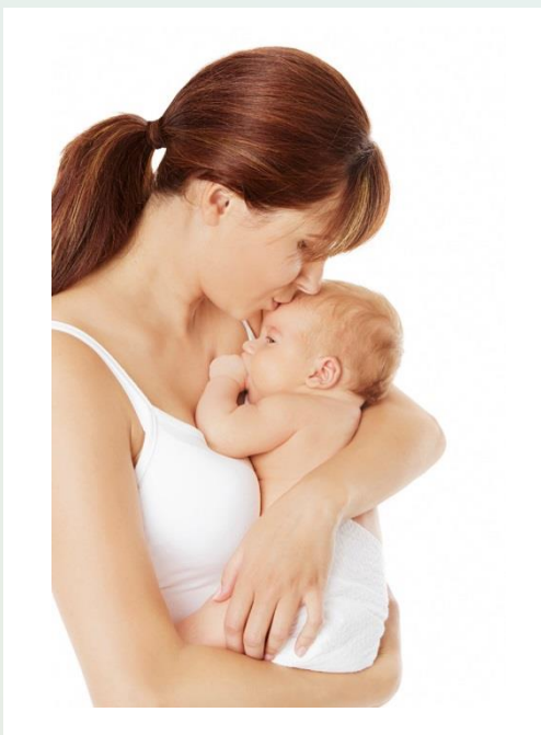
Miminko a maminka